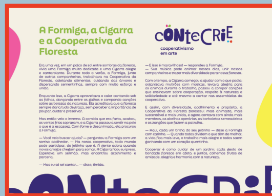
Fábula disponível no site: www.independentes.coop.br/projetocontecrie